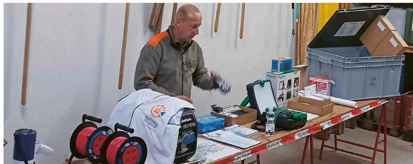
Notfalltreffpunkt-Material zur Unterstützung der Bevölkerung.