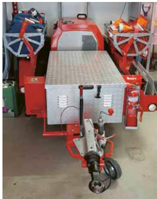
Auch die Motorspitze kann im Einsatz relevant sein.