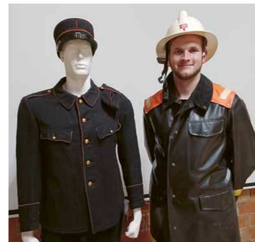
Alte und neue Kleider.

Nicht jede Feuerwehr ist auf allen Gebieten mit Spezialgerät ausgerüstet. Bei Verkehrsunfällen oder wenn wir in «die Höhe» müssen, können wir auf die Hilfe der Feuerwehr Biberist zählen. Auch hier zählt die Zusammenarbeit. Gemeinsam und miteinander zum Wohle der Betroffenen.