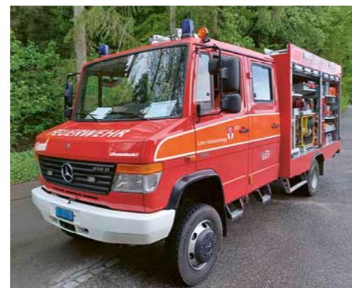
Das «Flämmli» – die Werkzeugkiste auf 4 Rädern.

Wie gross die Verbundenheit ist, merkt man u.a. auch daran, dass die einzelnen Fahrzeuge liebevolle Namen tragen, wie das Tanklöschfahrzeug «Flämmli», oder wie Bruno sagt, «unsere Werkzeugkiste auf 4 Rädern». Mit diesem Auto können Erstinterventionen in allen Ereignisbereichen vorgenommen werden.