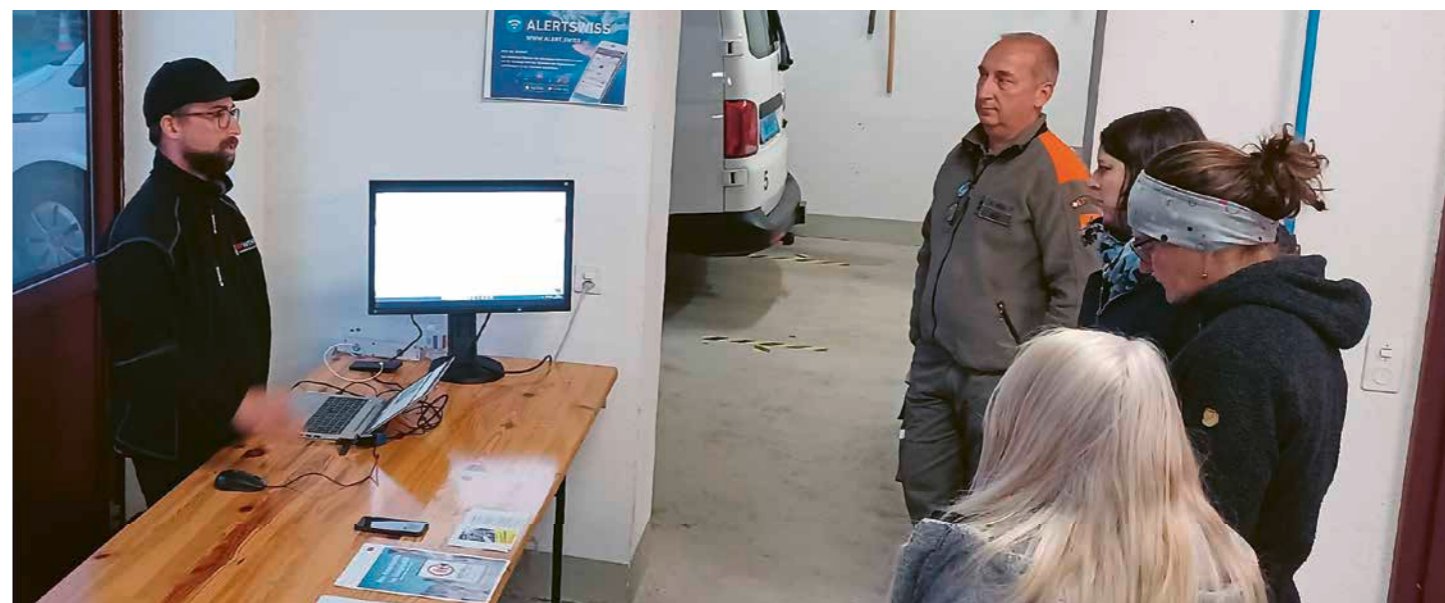
Was tun in Notfallsituationen? Diese und andere Fragen konnten am Infostand «AlertSwissApp» aufgeworfen werden.