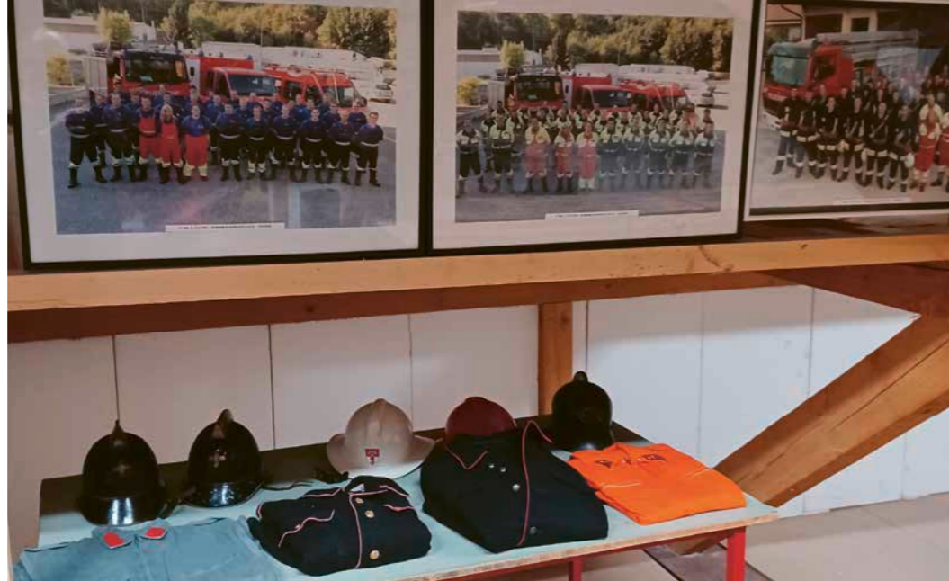
Alte Uniformen und Mannschaftsbilder zieren das Dachgeschoss.